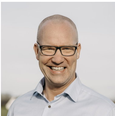
4 Christian Bock Flottenadmiral Wahlkreis 1